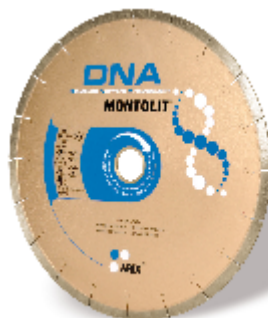
Disc diamantat SCX250 inclus