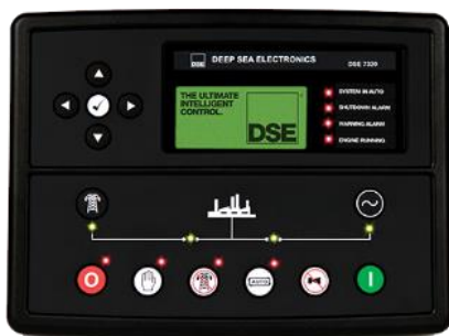
STANDARD DSE 6120 UK

- Componente instalate in cutie metalica, la interior, vopsit in camp electrostatic si protejat impotriva coroziei, usa cu acces facil.