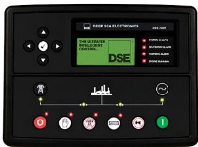
STANDARD DSE 6120 UK

- Componente instalate in cutie metalica, la interior, vopsit in camp electrostatic si protejat impotriva coroziei, usa cu acces facil.